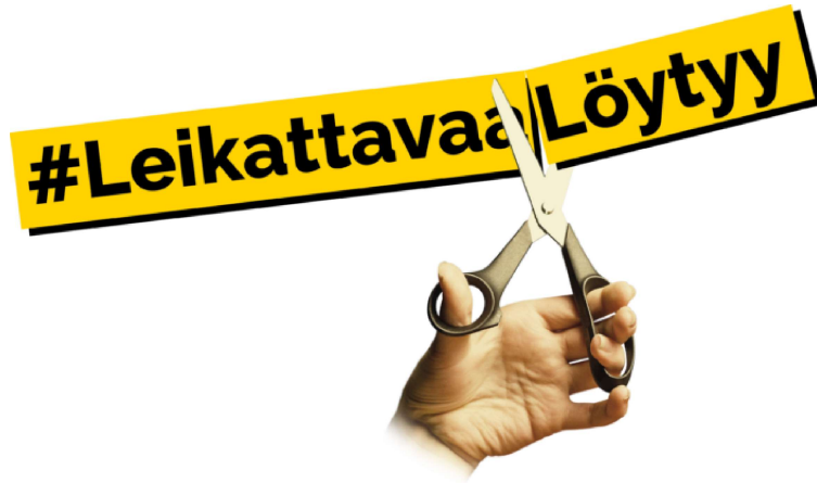
Kuva 1: LeikattavaaLöytyy-vaihtoehtobudjetin logo

odotettiin. Suurin vaikuttava tekijä lienee ollut ns. taktinen äänestäminen, josta kertovia yhteydenottoja saatiin kansalaisilta vaalien jälkeen. Toisaalta, positiiviseksi voidaan lukea se fakta, että puolueen saama äänimäärä kuitenkin liki kolminkertaistui vuoden 2019 eduskuntavaaleista ja yli 15-kertaistui vuoden 2022 aluevaaleista.