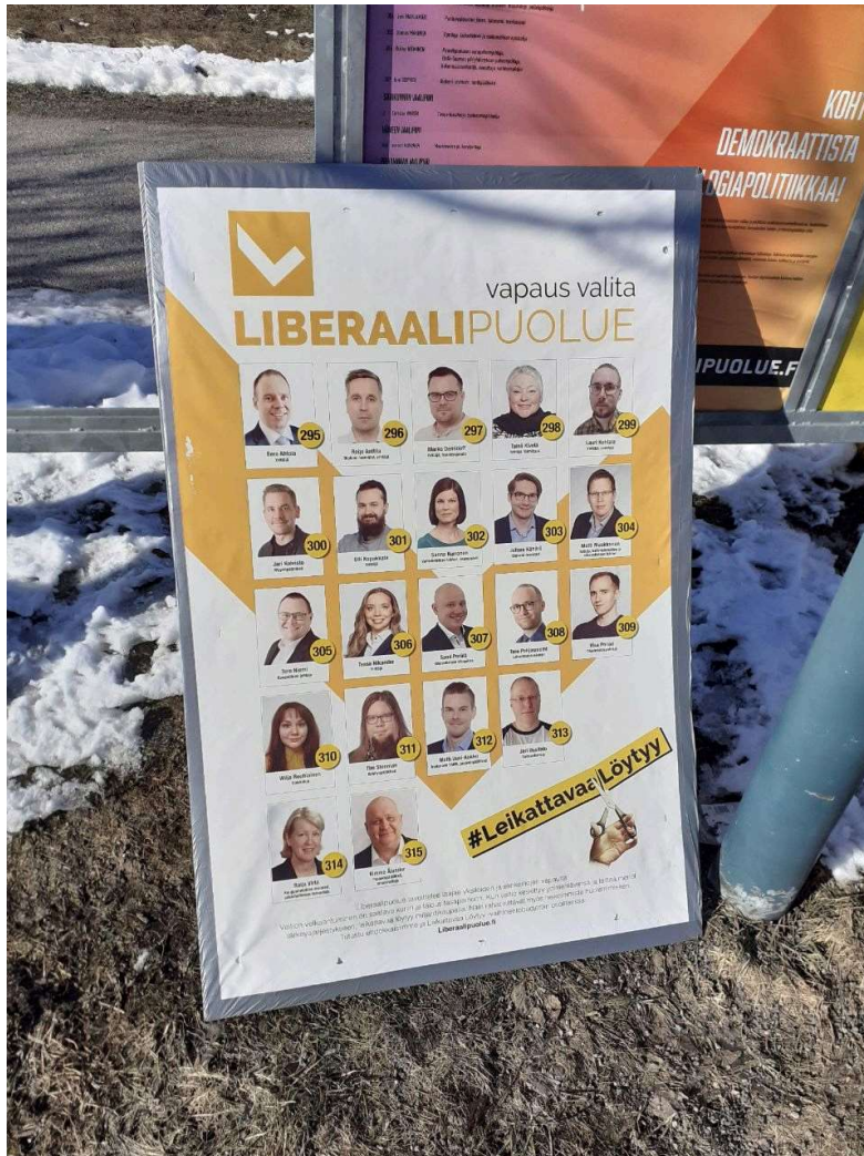
Kuva 3: Liberaalipuolueen Uudenmaan ehdokasjulistte pois kerättäessä Tuusulassa 2023-04-03.