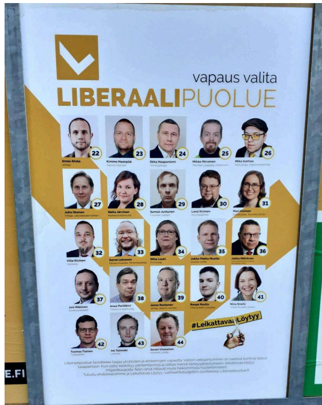
Kuva 2: Liberaalipuolueen Helsingin ehdokasjulistetelineessä Kampissa Forumin vieressä 2023-03-15.