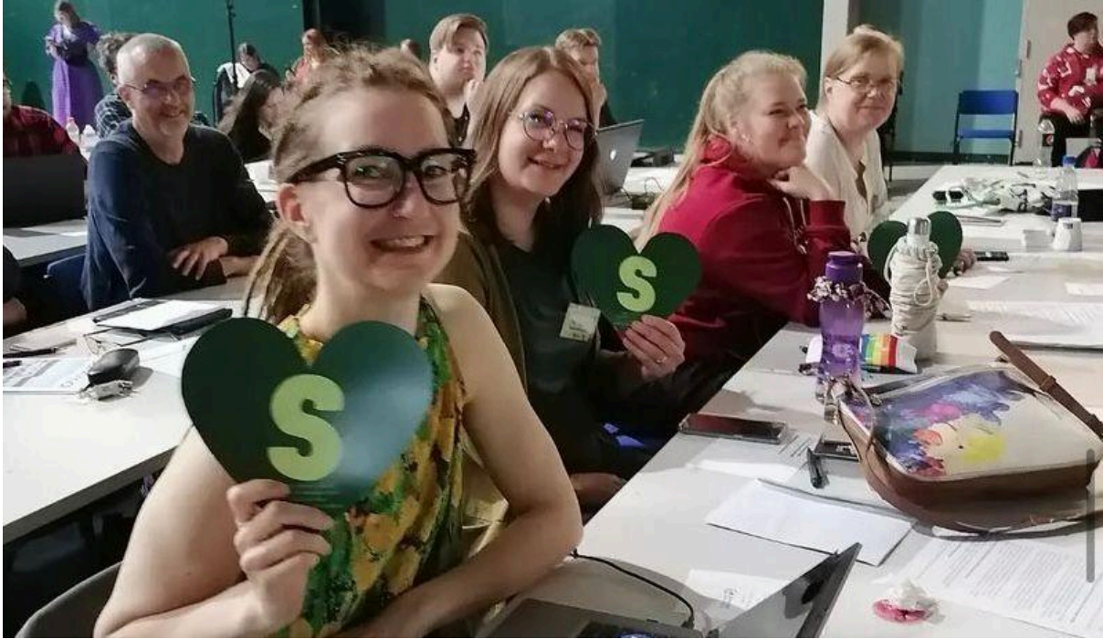
Vaasan vaalipiirin edustaja Vihreiden puoluekokouksessa Seinäjoella.