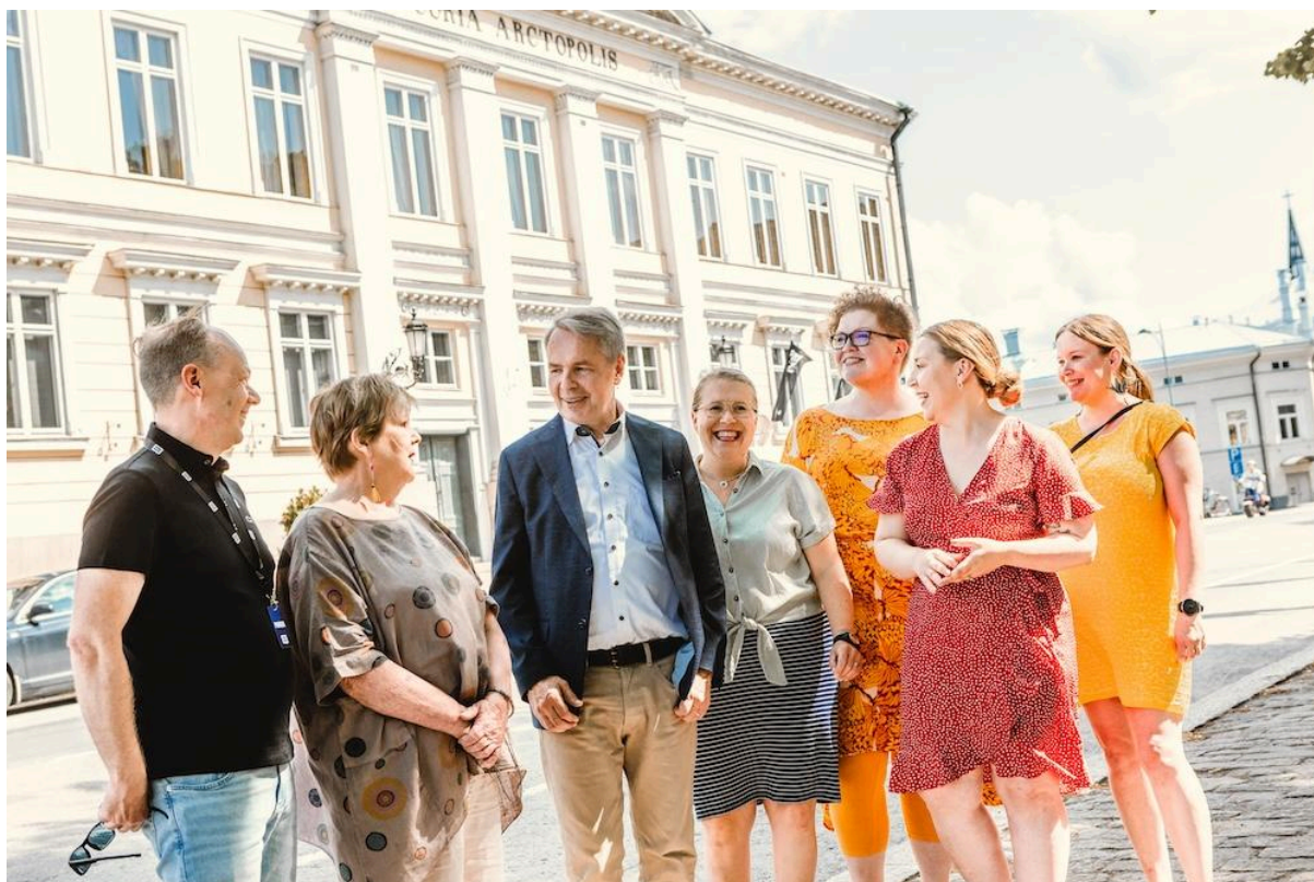
Pekka Haavisto Porissa tapaamassa valtuutettuja SuomiAreenan aikaan.

Yhdistykset ja piiri silti tukivat valitsijayhdistystä ja tukiryhmää kampanjassa sekä kannattajakorttien keräämisessä. Kannattajakortteja kerättiin Vihreiden kaikissa tapahtumissa, esimerkiksi SuomiAreenan kansalaistorin pisteellä.