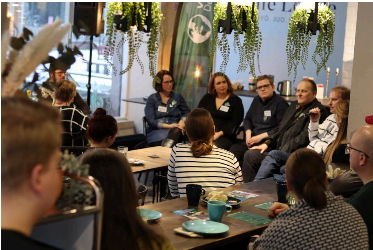
Eduskuntavaaliehdokkaat keskustelemassa tasa-arvon edistämisestä Caffe Localessa.

Vaalitulos oli sekä valtakunnallisesti että paikallisesti tappio ja pettymys, mutta siihen oltiin osattu varautua galluppien valossa. Lopullinen tulos, 7% ja 13 kansanedustajaa, oli kuitenkin vielä huonompi kuin gallupitkaan olivat osanneet ennustaa (vrt 2019 11,5% ja 20 kansanedustajaa).